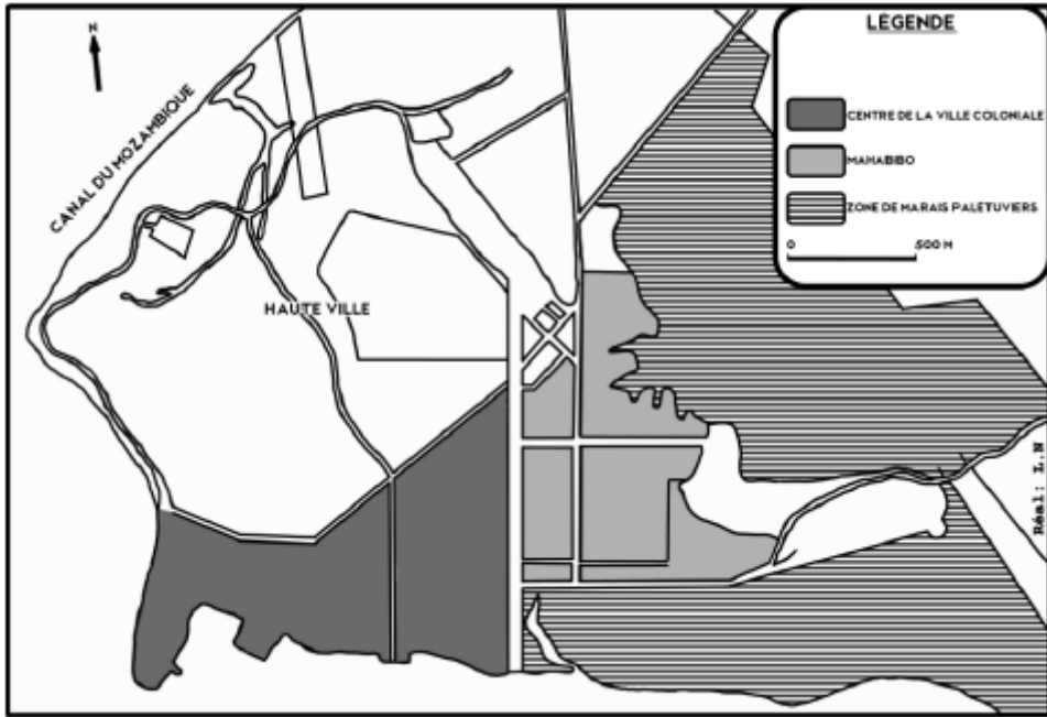
Carte de Majunga dans les années 1930-1940

de main-d'œuvre pour le port et les chemins de fer, ou de domestiques, la population africaine afflue rapidement des environs ou de régions plus lointaines.