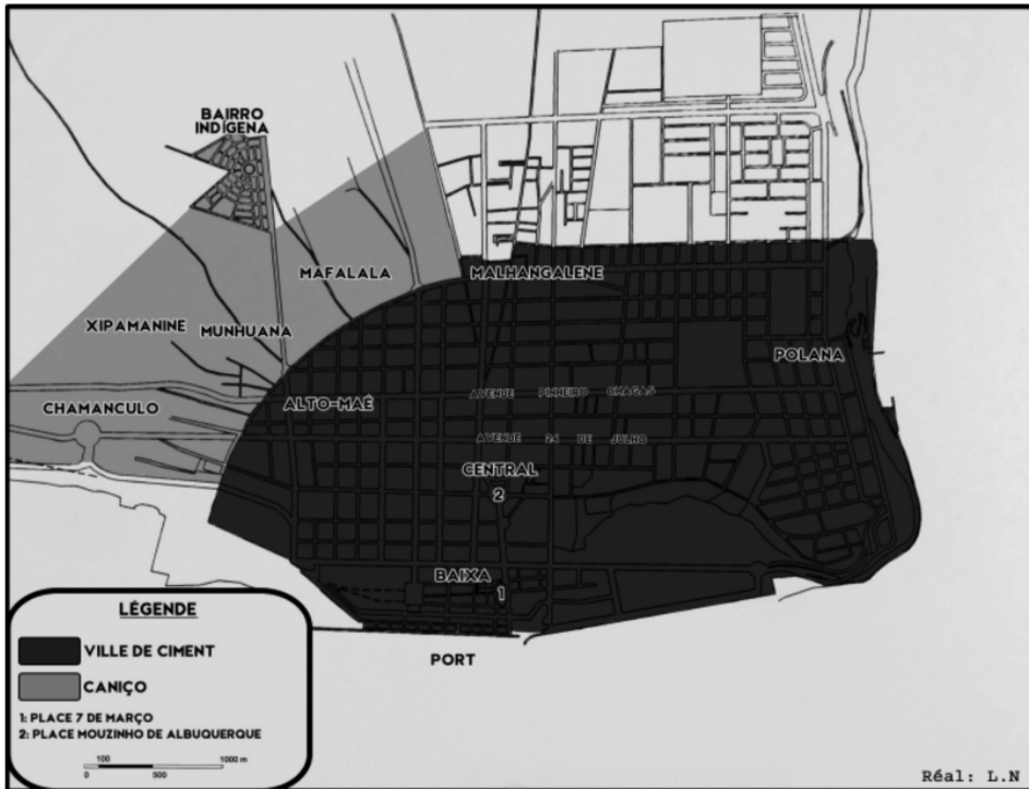
Carte de Lourenço Marques dans les années 1930-1940

Les trois villes à l'origine de cette réflexion sur les loisirs ont des rapports différents à l'histoire, à l'urbanité et à la citoyenneté. Par leur taille, leur passé, l'application plus ou moins forte de la ségrégation, le poids et le rôle de leurs élites indigènes, elles offrent un échantillon de villes utile à la connaissance du fait urbain en Afrique de l'Est et dans les îles de l'océan Indien.