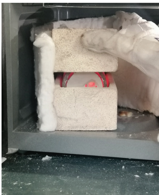
Fig. 4 Mufla MW, incandescência no processo de cozedura de molde refractário por micro-ondas.