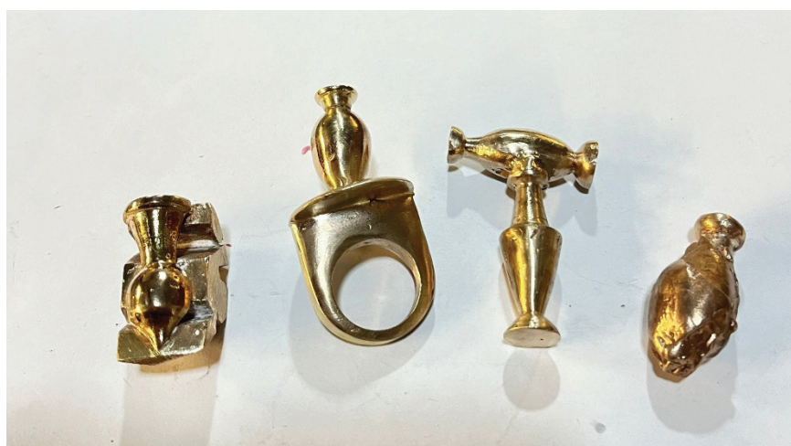
Fig. 11 Modelos de latão após serem cortados da fundição de metal da árvore.