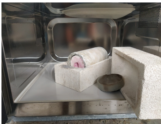
Fig. 3 Mufla MW.

permitindo o elevar exponencial da temperatura em segurança, em relação ao normal funcionamento do aparelho de micro-ondas (Moreno, 2022). O tijolo refractário de baixa densidade, excelente isolante térmico, é transparente às micro-ondas. Permite que estas passem através dele para o interior, ao mesmo tempo que retém a energia, promovendo a condutividade térmica às moldações. Estas, tem as suas propriedades dielétricas alteradas e a sua capacidade de aquecimento em micro-ondas diminuída, ao secarem durante o processo de tratamento térmico. O contacto com o cilindro de carbureto de silício, composto mineral que funciona como elemento eletromagnético, como susceptor, alto absorvedor de micro-ondas (Moreno et. al., 2021), com especial capacidade de absorção de energia micro-ondas a temperaturas médias e altas, de forma estável (Chhillar, 2008), permite compensar o acréscimo de temperatura.