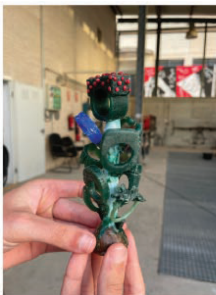
Fig. 10 (Dir) Modelos de cera na árvore de cera.