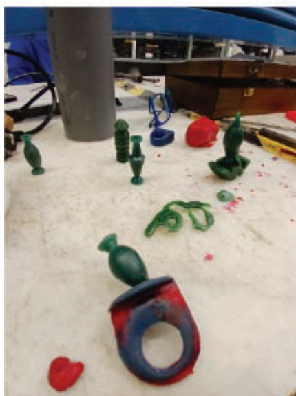
Fig. 9 (Esq) Modelo de cera..