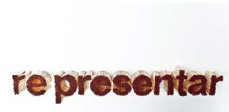
Figura 1 · Manuel Casellas, 1 gr de blanco sobre blanco, 2011. Técnica mixta, medidas variables. Colección particular, Sevilla.