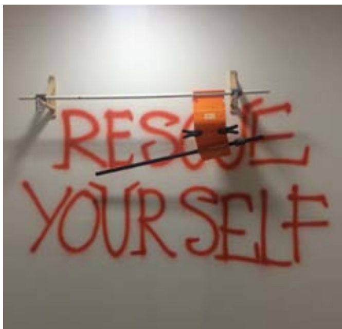
Figura 5 · Manuel Casellas, Work in progress, 2015. Instalación (impresora, destructora y papel), medidas variables. Colección particular, Sevilla.