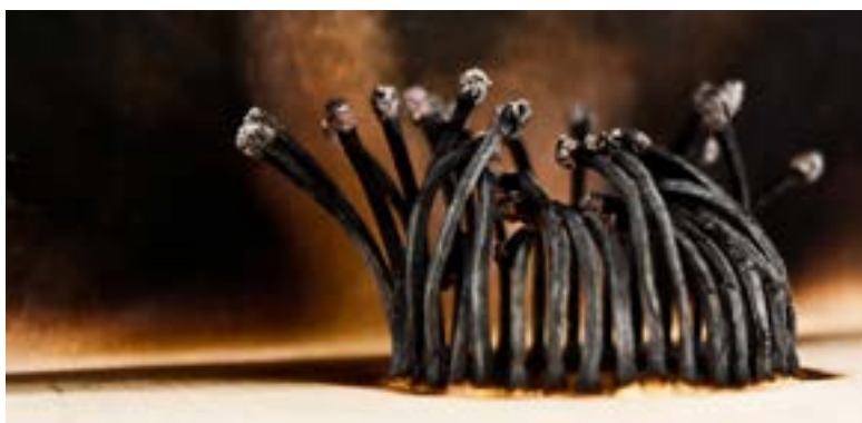
Figura 3 · Manuel Casellas, Sistemas ED.1, 2014. Fotografía sobre papel Hahnemühle, 40 x 100 cm. Colección particular, Sevilla.