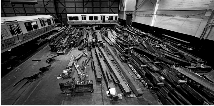
Figura 2 – Francesc Torres, una de les imatges que forma part de Memòria fragmentada . 11-S NY (2011). Font: F. Torres.