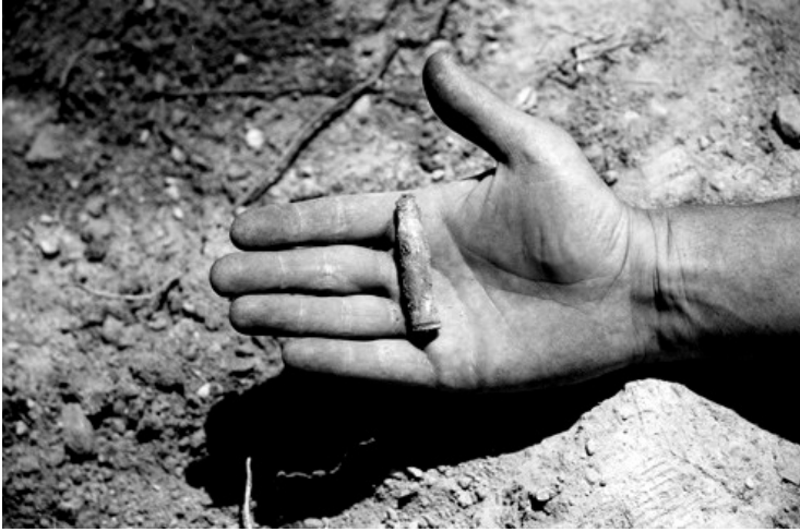
Figura 1 – Francesc Torres, Dark is the room where we sleep (2007). Font: F. Torres

Revisant treballs dels artistes Francesc Torres (Barcelona, 1948) i Walid Raad (Chbanieh, Líban, 1967), fundador del projecte The Atlas Group, es proposa un itinerari que pretén revisar els seus posicionaments artístics i personals vers conflictes, les seves reflexions sobre el paper de la memòria i la documentació d'aconteixements històrics. Dos artistes singulars de contextos bastants allunyats -tanmateix amb part de la seva trajectòria des dels Estats Units- però amb preocupacions similars com la guerra, la memòria col·lectiva i individual, l'arxiu i el contra-arxiu d'ús polític, i la investigació de les seves fonts.