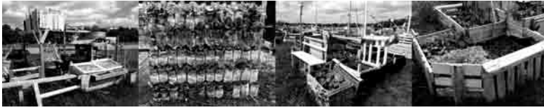
Figura 1 - Horts a l'aeroport Tempelhof, Berlin (Associació Allmende-Kontor). Detall Prinzessinnengarten, Berlin.

pròpia, útil, carregat de significat i de vida. Un dels trets característics és la seva estructura de bricolatge de gran precarietat, producte d'una determinada estètica DIY (do it yourself), recuperant materials de rebuig com canonades, caixes dels supermercats, materials de construcció abandonats, i utensilis inservibles.