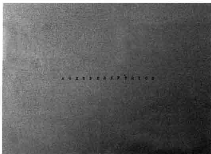
Figura 2 i 3 · A l'esquerra: Pau Faus (2008) La Ciudad jubilada . Font: http://paufaus.net/portfolio/la-ciudad-jubilada/ . A la dreta: Ignasi López (2012) Agroperifèrics . Font: http://cargocollective.com/bsidebooks/AGROPERIFERICOS-Ignasi-Lopez