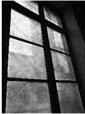
Figura 3 · Ignasi Aballí (1995). Pols . Pols sobre vidre i làtex, dimensions variables cada un

i els estructura. És el material pictòric que obra noves vies d'investigació per a la pròpia pintura. És aquí on el pas del temps es fa més visible. Moltes de les seves obres, com Bufades (desaparició) (1998) o Pols (1994 i 1996), ens remeten a una espera, a una acumulació pacient, a una recol·lecció constant d'elements efímers i sovint imperceptibles, de caràcter brut, on la formalització deriva cap a peces molt complexes i difícils de manipular i conservar. Algunes de les produccions s'han de refer de nou cada cop que es volen mostrar al públic.