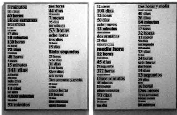
Figura 4 · Ignasi Aballí (2007) Classificats (rosa) . Pintura i impressió digital. 200 × 190 cm