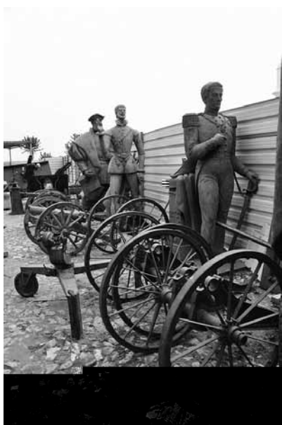
Figura 3 · Kiluanji Kia Henda. Balumuka (Ambush) 2011/série.