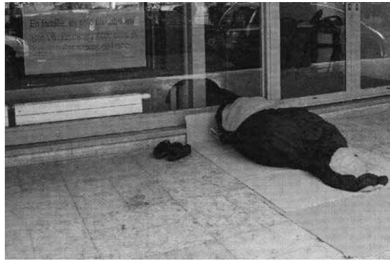
Figura 6 · O.R.G.A.S.M. — Organization of African States for Mellowness , 2011