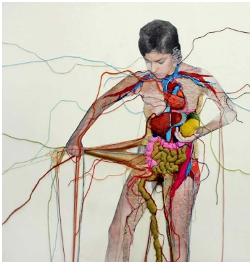
Figura 1 - Ana Teresa Barboza. Bordado . 2006 técnica mista. 147 x 140 cm.