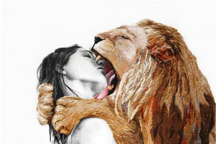
Figura 3 · Ana Teresa Barboza. Animales Familiares .

2011 Bordado s/ tecido. 33 x 39 cm. Fonte: