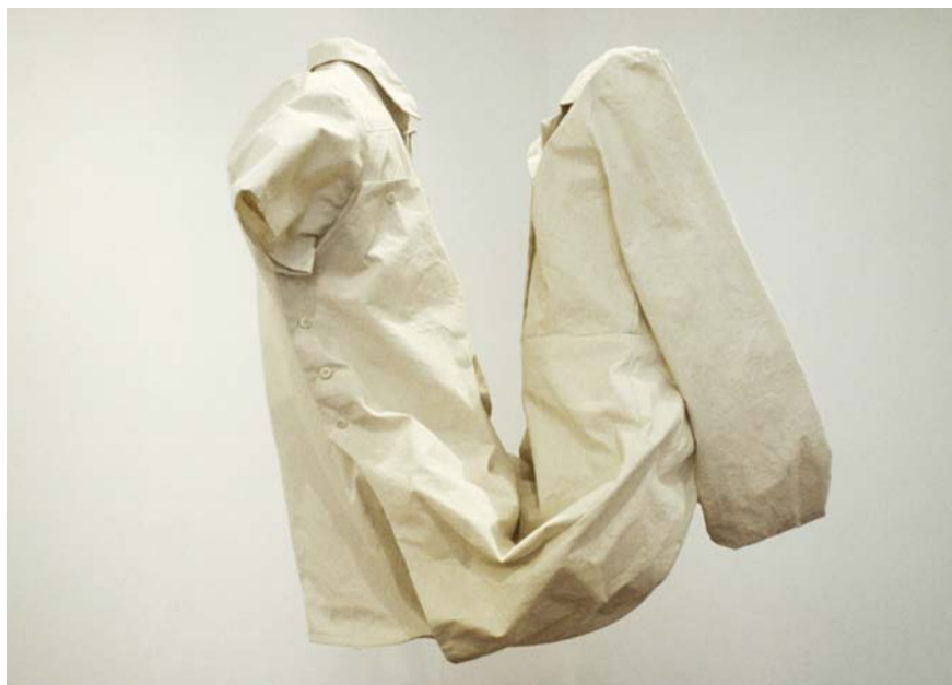
Figura 5 - Ana Teresa Barboza. Prendas para Dos . 2009. Tecido. 50 x 70 x 60 cm