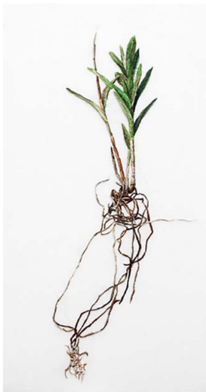
Figura 6 - Ana Teresa Barboza. Estructura de la raíz. 2013. Bordado sobre tecido. 38 x 42 cm.