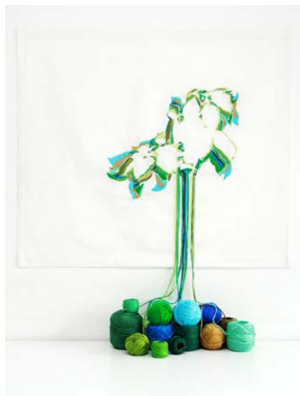
Figura 8 · Ana Teresa Barboza. Crecimiento . 2015. Bordado sobre tecido.