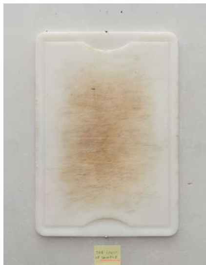
Figura 1 · Manuel Franquelo-Giner, Absent referents , Chopping table #1 , 2014, impresión inkjet sobre papel canson, montado en panel de aluminio, 130 x 95 cm. Fuente cedida por el creador.