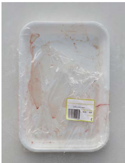
Figura 2 · Manuel Franquelo-Giner, Absent referents , Foam tray #1 , 2014, impresión inkjet sobre papel canson, montado en panel de aluminio, 130 x 95 cm.