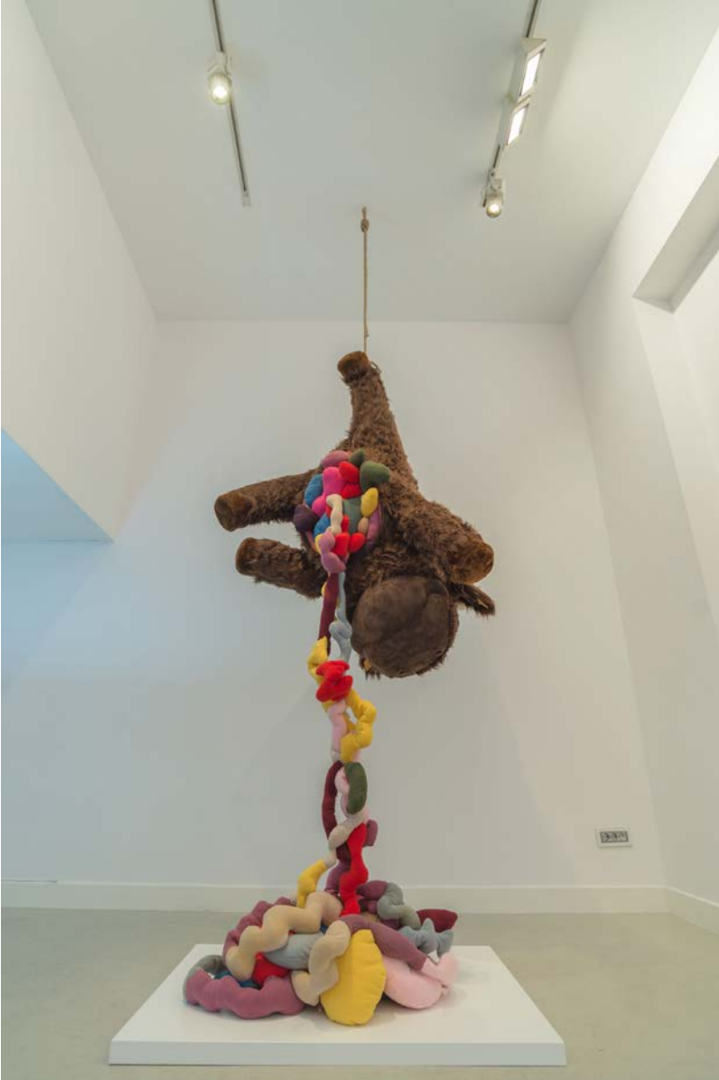
Figura 3 · Manuel Franquelo-Giner, Baby calf , 2017, estructura de espuma reticulada rellena de gata, forro en peluche cosido a mano y ojos de poliéster pulido, 200 x 80 x 80 cm.