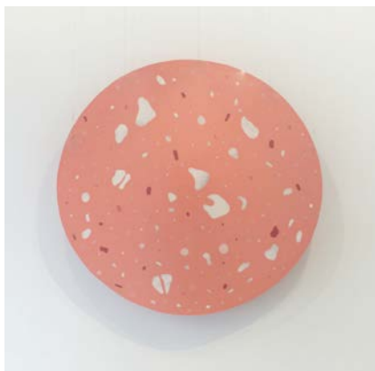
Figura 4 · Manuel Franquelo-Giner, Perdiendo el significado (Bacon 1€) , 2015, múltiples capas de silicona pigmentada, 230 x 80 x 1 cm.