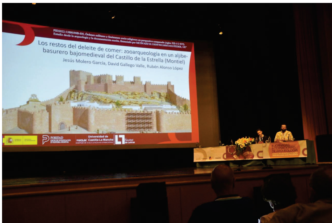
Figura 2 – Apresentação de estudo zooarqueológico referente ao Castillo de la Estrella – Montiel.

Na secção Deleites de Comer e Beber o protagonismo coube à zooarqueologia, que, através de análises de restos faunísticos, deu a conhecer os hábitos alimentares de duas elites: da cidade de Setúbal e dos freires da Ordem de Santiago que habitaram o Castillo de la Estrella (Montiel, Ciudad Real).