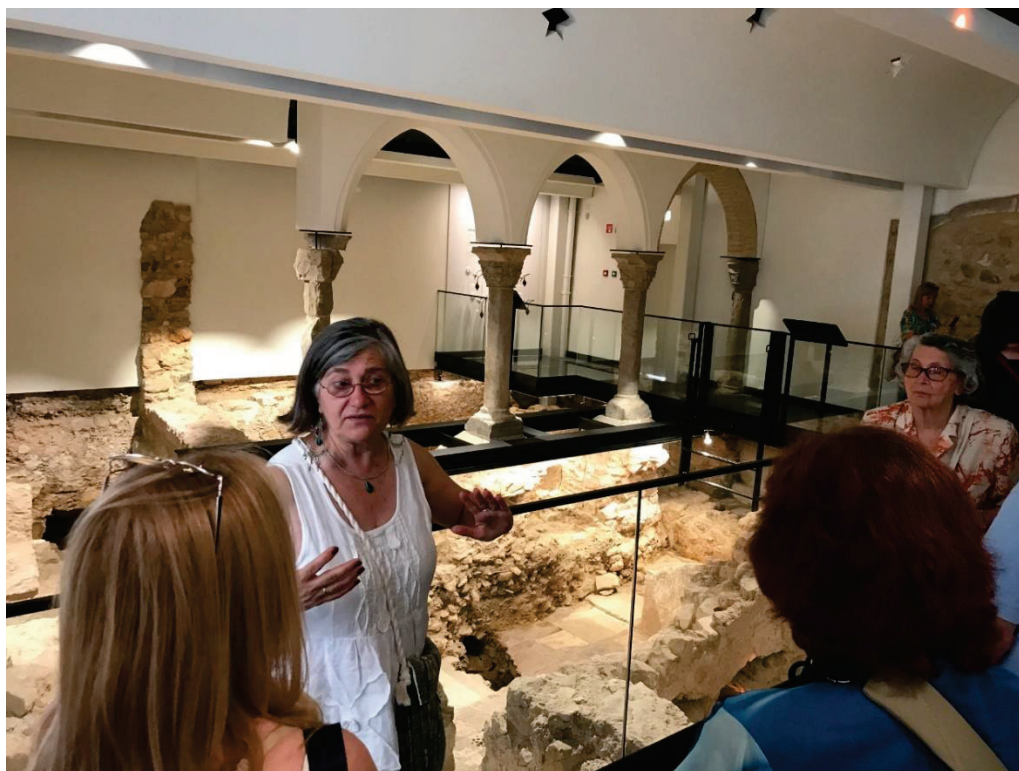
Figura 4 – Visita aos Banhos Medievais Islâmicos de Loulé.

Com ocupação entre o século I e o século XI, o majestoso templo que servia a residência senhorial de Milreu, construído no século IV, foi cristianizado no século VI e usado como espaço cemiterial durante o período islâmico. A explanação sobre os detalhes arquitectónicos e funcionais do edifício, bem como sobre a sua evolução, garantiu aos participantes na visita a percepção da valia científica deste sítio arqueológico.