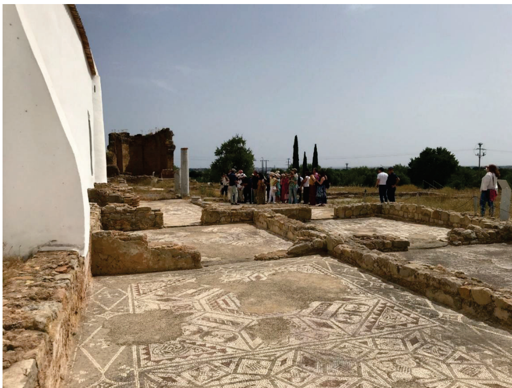
Figura 5 – Visita à Villa romana de Milreu.