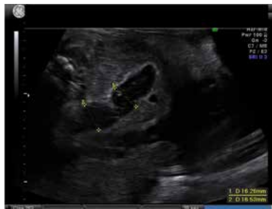
Figura 3 – Gestação de 26 semanas: hiperecogenecidade da parede intestinal e dilatação intestinal.

Às 26 semanas constatou-se dilatação de ansa intestinal, com suspeita de atresia intestinal, que manteve nas ecografias subsequentes (Figura 3). O VLA normalizou progressivamente.