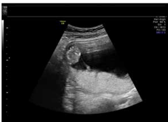
Figura 1 – Gestação gemelar monocoriônica biamniótica de 14 semanas: oligoamnios do feto 2 e hidramnios do feto 1.

Repetiu ecografia às 14 semanas que mostrou diminuição do volume de líquido amniótico (VLA) do feto 2 e discordância dos valores de CCC: feto 1: 87mm; feto 2: 77mm. A fluxometria do ductus venoso de ambos os fetos não mostrou alterações (Figura 1).