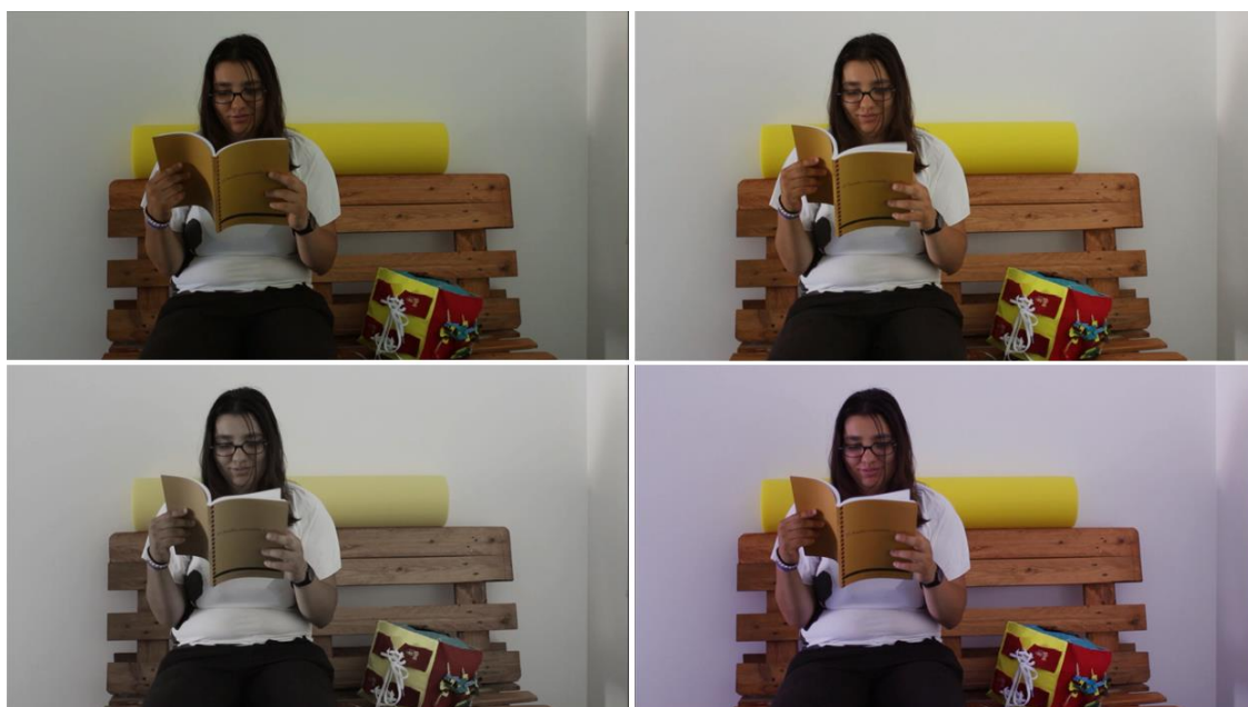
Figura 3: Comparação relativa à correção de cor da frame

Na primeira versão (topo, lado direito) foram utilizados tons mais quentes e em simultâneo mais brilhantes, que lhe conferem mais vivacidade quando comparado com as imagens originais. Na versão dois apostou-se num registo diferente, com menos contraste e saturação, o que originou uma imagem com menos vida, com aproximação de tons cinza. Na última versão foi aumentado o nível de azul, o que tornou a imagem mais arroxeadada, ainda que se tenha mantido uma imagem com cores vivas.