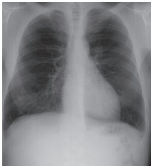
Fig. 2 – RXT anteroposterior, quatro semanas após antibioterapia, demonstrando a resolução dos infiltrados alveolares presentes no terço inferior do campo pulmonar direito

campo pulmonar direito (Fig. 1). O doente foi internado no serviço de medicina interna com o diagnóstico de pneumonia da comunidade, persistente. Reiniciou antibioterapia com ceftriaxone e azitromicina. Ao terceiro dia de internamento as hemoculturas demonstraram a presença de Staphylococcus aureus meticilino-sensível. Realizou de imediato um ecocardiograma transtorácico, no qual se constatou a presença de uma vegetação 20mm×20mm na válvula tricúspide e insuficiência severa desta válvula, sem evidência de disfunção ventricular. Suspendeu a antibioterapia prévia, tendo iniciado flucloxacilina (durante 5 semanas) e gentamicina (durante 5 dias). O doente ficou apirético após 2 dias de terapêutica, tendo permanecido assintomático desde então. A proteína C reactiva normalizou e a RXT apresentou regressão progressiva dos infiltrados pulmonares (Fig. 2). As hemoculturas foram persistentemente negativas desde então. O ecocardiograma transtorácico, após quatro se-