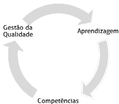
Figura 1 - Relação circular da gestão da qualidade, competências e aprendizagem

A figura 1 representa a relação entre o conceito de gestão da qualidade, competências e de aprendizagem, num processo circular, onde é difícil definir o que está antes e depois.