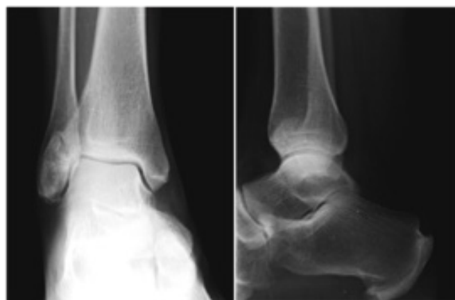
Figura 1. Radiografia do tornozelo direito: sinostose por ossificação heterotópica do ligamento tíbio-peroneal anterior distal.

Na radiografia simples realizada apresentava uma sinostose (ósseo-cartilaginosa) a nível da sindesmose anterior, por ossificação heterotópica do ligamento tíbio-peroneal anterior distal, que inicialmente foi interpretada como uma fratura de sinostose prévia, devido à sua componente rádio-transparente cartilaginosa (Fig. 1).