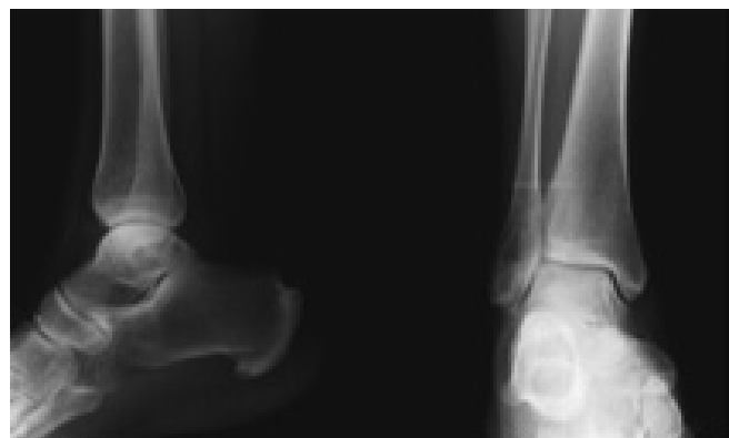
Figura 3. Radiografia do tornozelo direito – controlo aos 6 meses de seguimento.

A tibia e o perónio articulam-se em 3 regiões distintas: a articulação tíbio-peroneal proximal (superior), membrana interóssea e a articulação tíbio-peroneal distal (inferior) 9 . Esta última é formada pela superfície articular medial convexa do perónio e lateral côncava da tibia, sendo definida