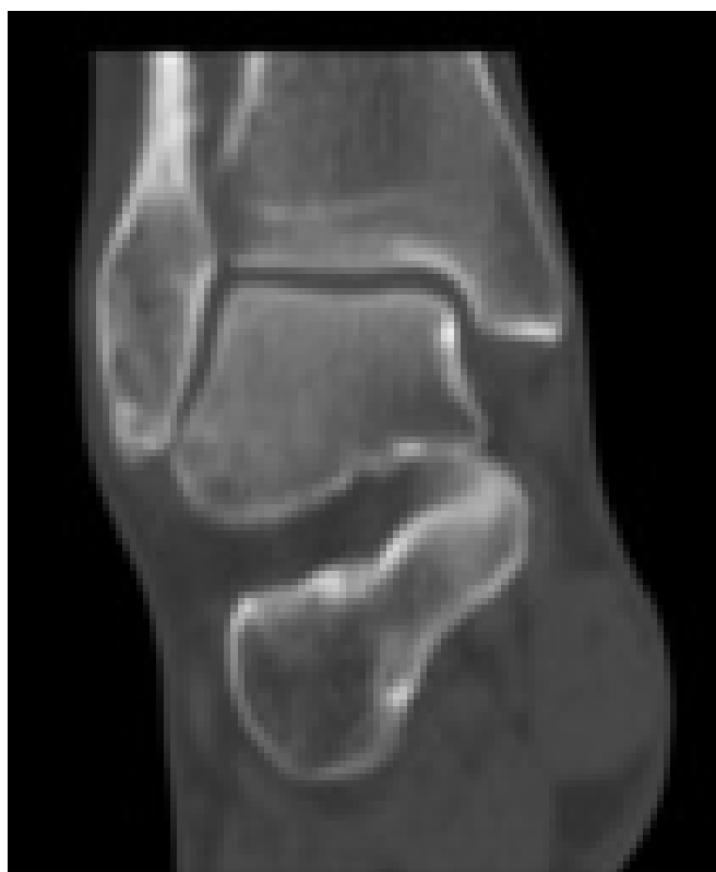
Figura 4. Tomografia Computorizada do tornozelo direito – Controlo aos 12 meses de seguimento.

como uma articulação fibrosa sindesmótica, sem cartilagem articular 9 .