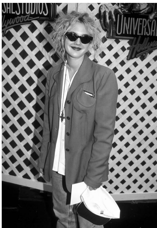
Figura 5 – A atriz Drew Berrymore no red carpet da inauguração de ET Adventure Ride , Universal Studios Hollywood. Junho de 1991.

Se para Scott Lash e John Urry (1994, 4), na sociedade contemporânea, “o que é cada vez mais produzido não são objetos materiais, mas signos”, de maneira que as mercadorias não seriam mais definidas por seu uso, mas pelo o que elas significam; o grunge, a partir de suas imagens – e as imagens, segundo Baudrillard (1981, 2009), desde os anos 1980 passaram a mediar as relações sociais numa proporção até então inaudita – tornou-se também uma economia. Num momento em que cultura e lazer são continuamente requalificados como práticas de consumo, o cinema, a música, a publicidade e a moda passaram a operar através de uma proximidade funcional. Da fria Seattle para as passarelas nova-iorquinas e o red carpet de Los Angeles, o underground era assim abraçado, celebrado e produtificado pelo mainstream .