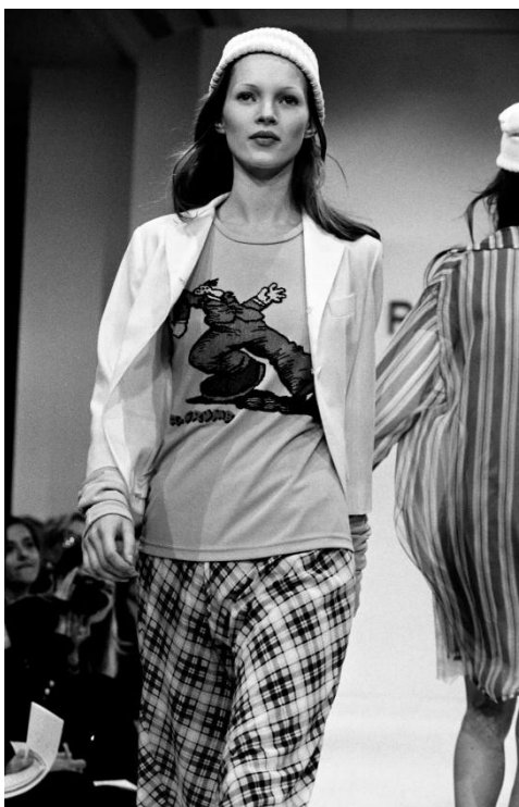
Figura 2 – Kate Moss desfilando a “grunge collection” de Marc Jacobs, 1992.

Jacobs era completamente contrária ao que se considerava uma roupa chique ou de design 14 . Verdadeiro fenômeno cultural, o grunge apareceu depois nas páginas da Vogue num editorial chamado Grunge and Glory , produzido por Grace Coddington, estrelado por Naomi Campbell e Kristen McMenamy e fotografado por Steven Meisel [Figura 3].