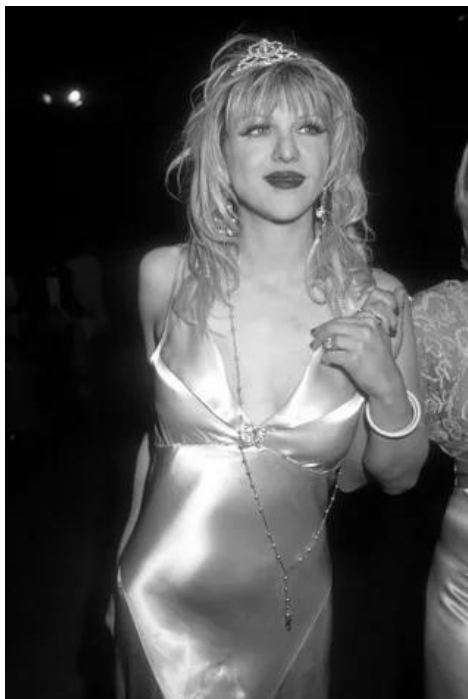
Figura 4 – Courtney Love vestindo “ slip dress ” que constituía parte do vocabulário indumentário da estética kinderwhore . After-party do Oscar de 1995.

de “ kinderwhore ” – onde o “ whore ”, puta em tradução literal, é o termo apropriado (e remasterizado) enquanto um disparador narrativo político [Figura 4].