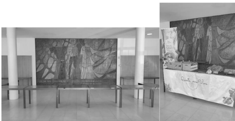
Figura 4 - Stands do 41º Mercado Good Food Hubs , ISEP.

Uma vez apresentados, é preciso começar por descrever a composição dos stands de venda dos alimentos biológicos como parte da metodologia mista (Verga & Khan, 2022). Para sua montagem, os produtores ocuparam parte do hall de entrada do edifício “H” do ISEP e do corredor “B” da FEUP, utilizando materiais das instituições de ensino parceiras, nomeadamente mesas escolares de 60cm por 80cm cada, como podem ser vistas a partir das Figuras 4 e 5 abaixo: