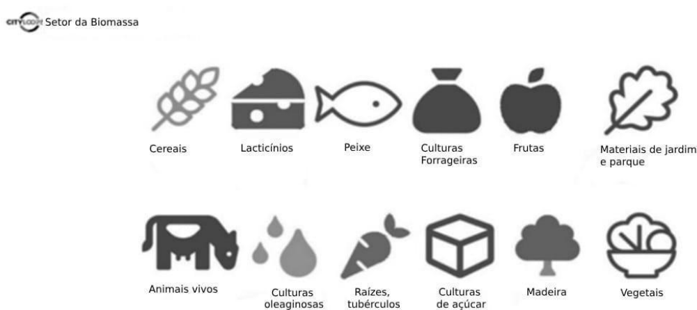
Figura 2 - As doze categorias de materiais do setor de biomassa.