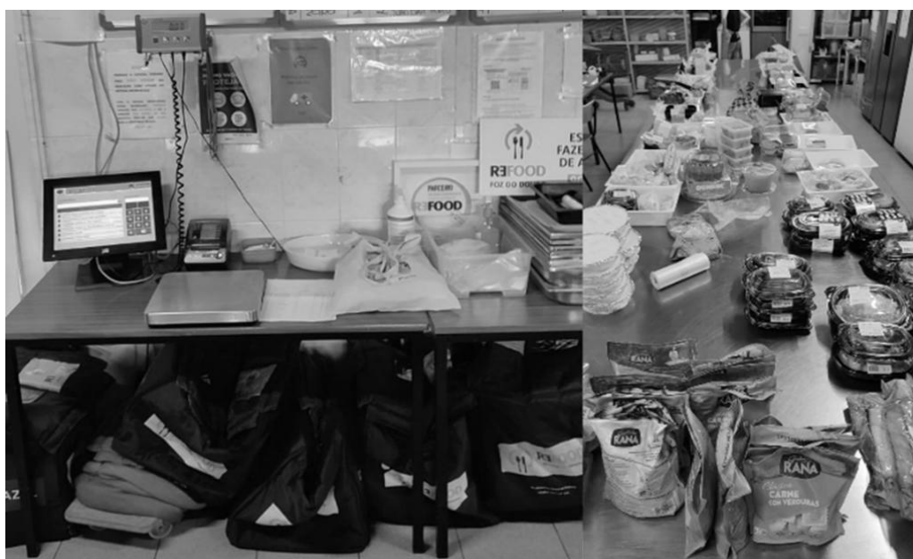
Figura 7 - Balança e alimentos.

com a anuência da diretoria da Instituição e de todos os demais voluntários desta unidade da Refood . Em razão disso, foi possível medir o espaço público utilizado pela Refood Foz do Douro e chegar ao registro de 92m 2 de área destinada à prática circular, utilizada na recuperação de alimentos e, também, na promoção do bem-estar social através do combate à fome. Ainda, foi possível desenvolver e aplicar, neste mesmo núcleo, um software para o registro do fluxo dos materiais, em específico do excedente alimentar resgatado junto aos parceiros da Refood . O software está instalado em um computador que, por sua vez, conecta-se a uma balança, um ecrã e a uma impressora, como pode ser visto na Figura 7: