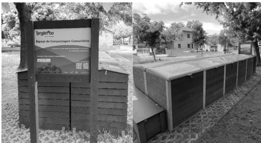
Figura 8 - Ilha de Compostagem Comunitária do Parque Infantil do Amial.

Constituem assim um importante equipamento colectivo que pode reduzir substancialmente a produção de resíduos através da reciclagem, e um valioso meio para se atender ao ODS número 12 ( United Nations , 2015). Ambos estão na zona da Asprela (consultar Figura 3) e podem ser conferidos a partir das Figuras 8 e 9: