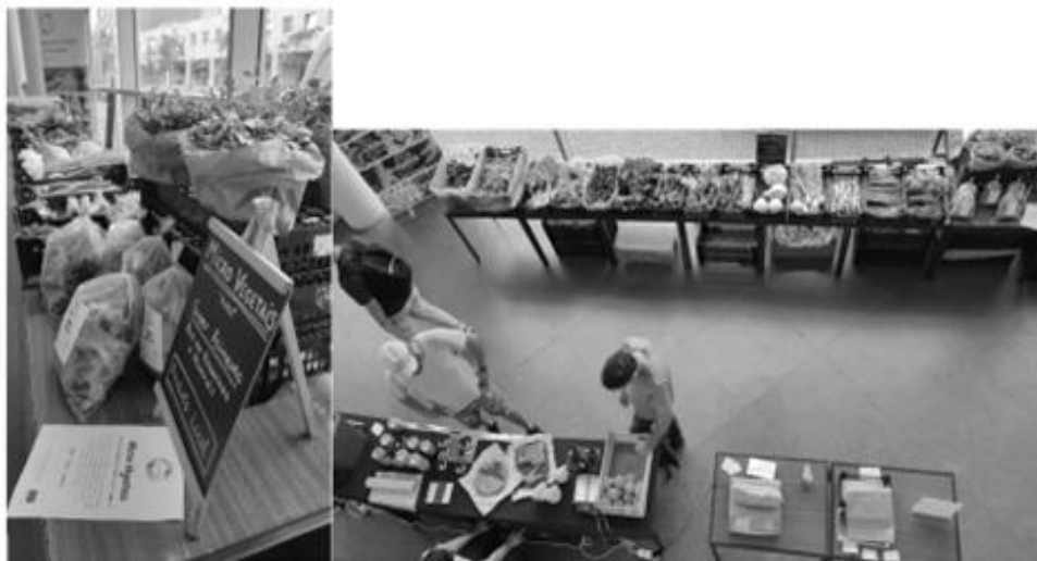
Figura 5 - Stands do 42º Mercado Good Food Hubs , FEUP.