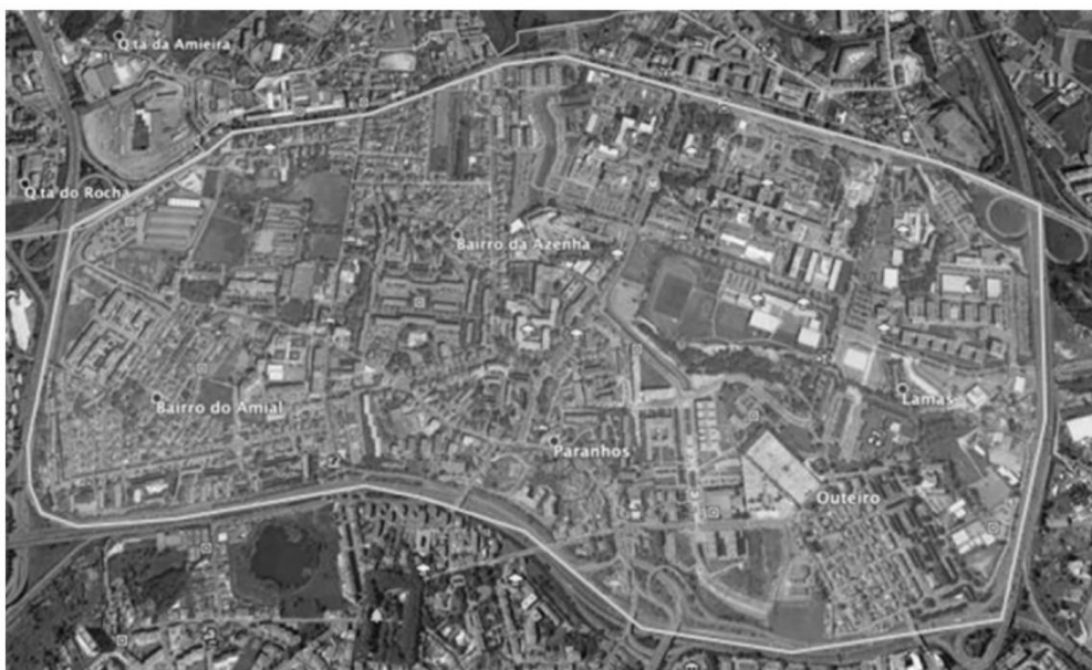
Figura 3 - Zona da Asprela, território-piloto para implementação do Good Food Hubs .