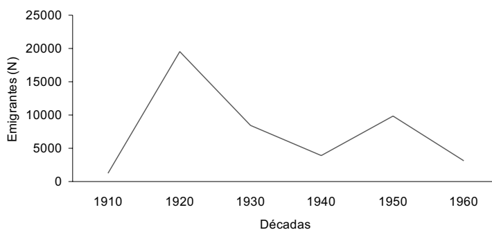
Figura 3 Emigração portuguesa para a Argentina, 1910-1960