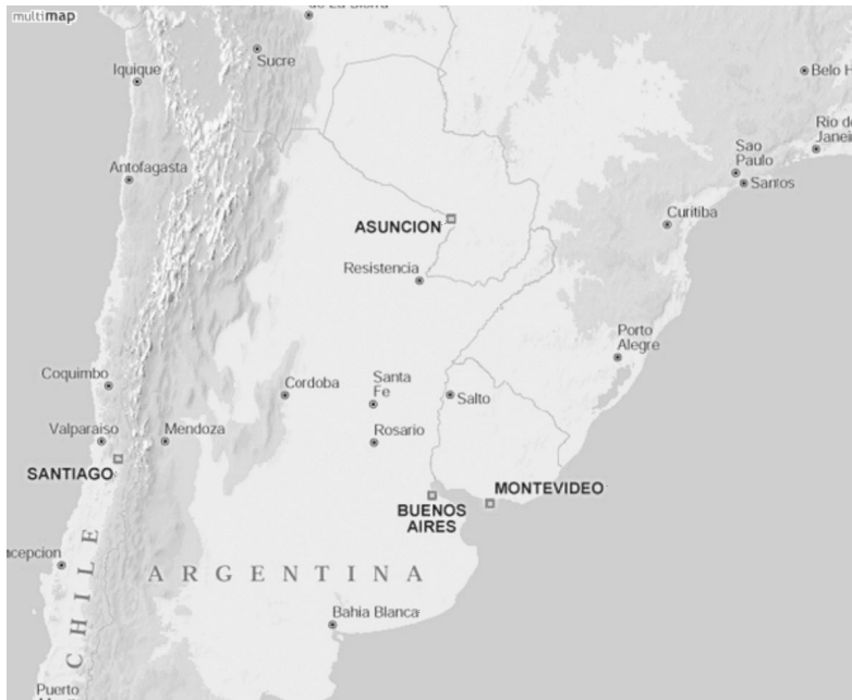
Figura 1 Mapa da Região Platina (Argentina Litoral, Sul do Brasil e Uruguai)

(Corrêa, 2000: 29). Aqui se combateria, nos séculos seguintes, pela definição dos novos limites entre Espanha e Portugal.