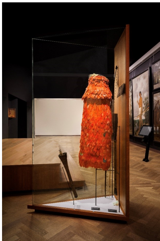
Figura 1: Manto tupinambá no Nationalmuseet da Dinamarca (2021)

Após negociações sigilosas, o Nationalmuseet anunciou a devolução em nota oficial, destacando que a doação é uma contribuição única e significativa para a recuperação do acervo do museu brasileiro, que foi em grande parte destruído durante um incêndio de grandes proporções em 2018.